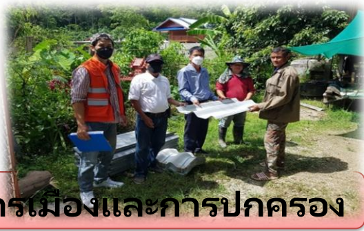
การเมืองและการปกครอง