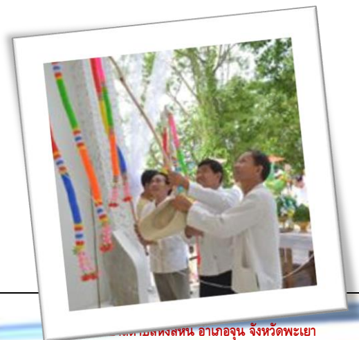
พิธีเปิดหลังสน อาเภออุ้ง จังหวัดพะเยา