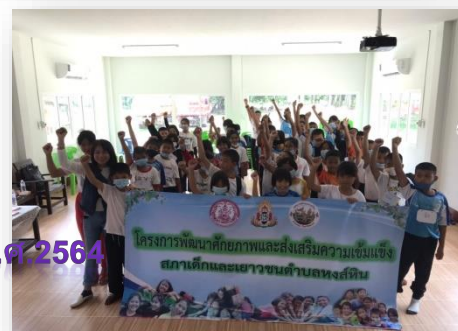
สรุปผลการดำเนินงานประจำปีงบประมาณ พ.ศ.2564

หมวดงบประมาณ ประเภทเงินสำรองจ่าย เทศบัญญัติงบประมาณ รายจ่ายประจำปี พ.ศ.2564